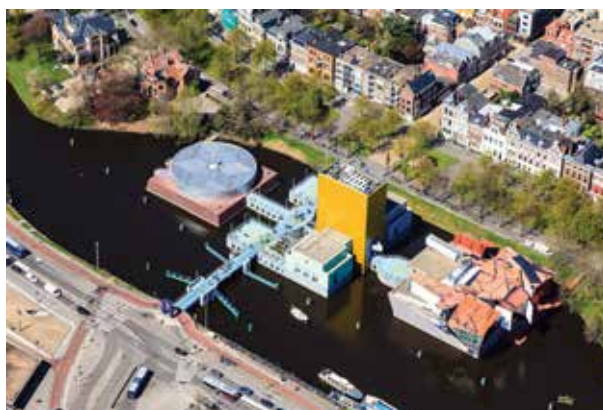
Groningeno muziejaus vaizdas iš paukščio skrydžio.

Piazos dešinėje esanti centrinė muziejaus dalis – Mendini kūrinys. Spalvingo paviljono viršuje įsikūrusi muziejaus bilietų kasa, suvenyrų parduotuvė, restoranas, o apačioje, kanalo vandens lygyje, – laikinoms parodoms skirtos salės. Vis dėlto dominuojantis šios dalies akcentas – „Aukštinis bokštas“