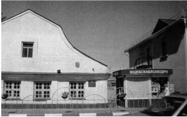
Pastovys. 2008, vasara.