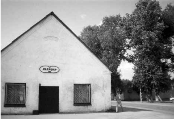
Lentupio „Kafeinia“. 2008. Iš prisiminimų autorės archyvo

nės, pabudavo vėliau. Plauki sau pro jas, žuvelės nardo greta, pliaukši. Ir laumžirgiai žaidžia, žvilga saulėje, ir visokio kito kio gyvio čia apstu. Varnai kairiajame niūriosios įkalmės miške kranksi, tarpusavy šnekasi. Vanduo tobulai švarus – jokių tilteilių, jokių valčių, jokios civilizacijos. O lenkmytyje, sako, buvo prieplaukėlė, kaimiečiai irstydavosi valtimis, maudė vaikus, kurių kaime buvo daugybė, rengė piknikus. Dabar tai beveik „negyvenamas“ ežeras, ir jo vardas ne veltui pamirštas, nes nebėra tų, kurie tuos vardus teikė. Tik retsykiais į mūsų paplūdimį aukštos žalios kalvos papėdėje arba į žemą krantą dešiniau iš kitų kaimų atvažiuodavo triukšmingos kompanijos. Savaitgalį, būdavo, pašūkauja, pageria, pasimaudo ir išnyksta, palikę ant kranto daugybę išrautų lelijų... Kam jas rovė? Išmėtytas šiukšles ir butelius, būdavo, surenkam, kas dega – sudeginam. Taip darėm kartą, kitą, trečią, ir atvykėliai nustojo šiukšles palikinėti arba į mūsų lauzavietę krūvon sumesdavo. Ir tai jau geriau.