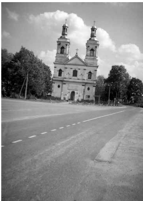
Lentupio bažnyčia. 2008.