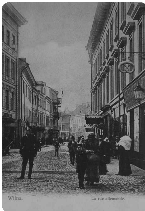
Vokiečių gatvė. Apie 1903. Atvirukas

Adomas Honoris Kirkoras (1818–1886) knygoje „Pasi-vaikščiojimai po Vilnių ir jo apylinkes“ (1856) aprašo Vokiečių gatvę ir pamini keletą įdomių, su gatvės namais susijusių istorijų. Pasirodo, netoli Rotušės stovėjęs kažkada Grigaliui Astikui priklausęs namas. Jo savininkas už slaptus ryšius su Rusijos caru Ivanu Rūsčiuoju ir pinigų padirbinėjimą 1580 m. birželio 18 d. Stepono Batoro įsakymu buvo nukirsdintas priešais savo namus. Kirkoras prisimena: „Namo frontone ligi šiol matyti lietuviškas Vytis, o po juo nišoje – gipsinė statula, vaizduojanti žmogų su ilga tunika, užrištomis akimis, viena ranka laikantį apnuogintą kardą, o kita – teisingumo simbolį – svarstyklės“. Buvo aiškinama, kad skulptūra, pastatyta po Astiko nukirsdinimo, ir yra įspėjimas, jog aklas teisingumas baudžia visus, nuo turtingiausių iki vargetų.