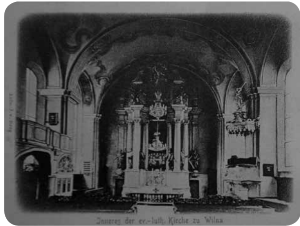
Evangelikų liuteronų bažnyčios vidus. Apie 1902. Atvirukas