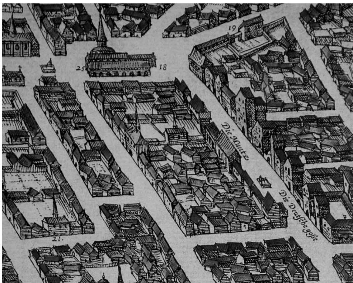
Vilniaus miesto planas. 1581. Georgo Brauno ir Franko Hogenbergo atlasas. Fragmentas