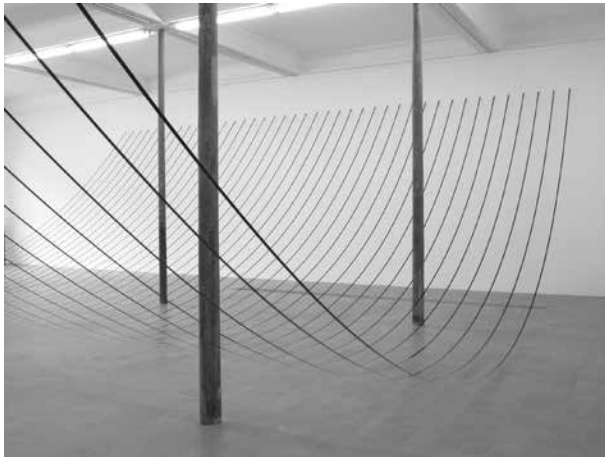
Žilvinas KEMPINAS. Štilis. 2003. Magnetinė juosta. Instaliacija šiuolaikinio meno centre Le Grand Café , Sen Nazere (Prancūzija), 2008

nansas yra, o didesnis jis ar mažesnis – man kol kas nerūpi, nes aš dar nepadariau visų savo darbų. Bet dėkui vėl už Eizenšteiną! Būtų gerai, kad dar porą sykių pakartotum tą pavardę čia, tada visi tikrai pamatytų ryšį su Eizenšteinu. Taip juk propaganda ir dirba. Ačiū Tau, Daiva!