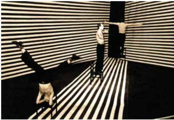
„Senė 2“. Pagal Daniilo Charmso ir Aleksandro Vvedenskio kūrinius. Režisierius – Oskaras Koršunovas, dailininkas – Žilvinas Kempinas. 1994. Lietuvos nacionalinis dramos teatras.

Manęs niekad nesaistė sutartys nei su „Vartais“, nei su kitom galerijom, dirbam tik abipusio supratimo ir geranoriškumo pagrindais.